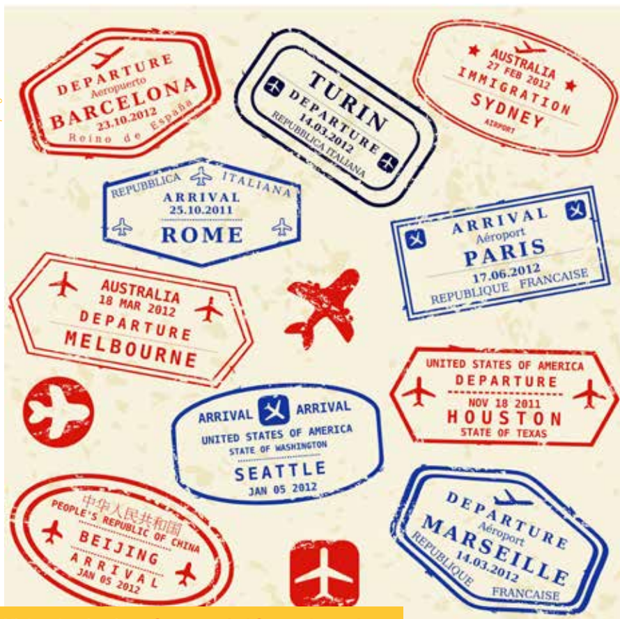
Viel und weit reisen: Statussymbol Stempelsammlung