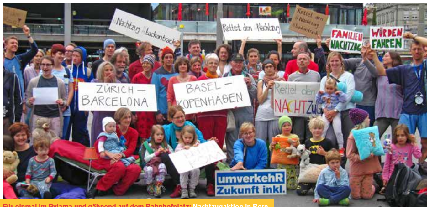
Für einmal im Pyjama und gähnend auf dem Bahnhofplatz: Nachtzugaktion in Bern

Eine Umfrage von umverkehR im April 2015 hat gezeigt, dass der Abbau der Nachtzugverbindungen den Billigfliegern Vorschub leistet. Sogar umweltbewusste Kunden wählen als erste Ausweichmöglichkeit die bis zu 50 Mal klimaschädlicheren Flugverbindungen. Der vermeintliche Einsatz für den Klimaschutz seitens des Bundesrats ist heuchlerisch, wenn gleichzeitig der klima- und umweltfreundlichsten Art, sich innerhalb des europäischen Kontinents fortzubewegen, jegliche Attraktivität genommen wird. Darum trifft sich das europäische Netzwerk erneut im Oktober, um gemeinsame Aktionen im Hinblick auf den Klimagipfel in Paris zu besprechen.